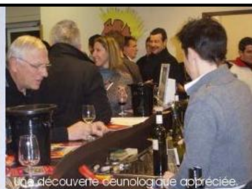
Une découverte œnologique appréciée.