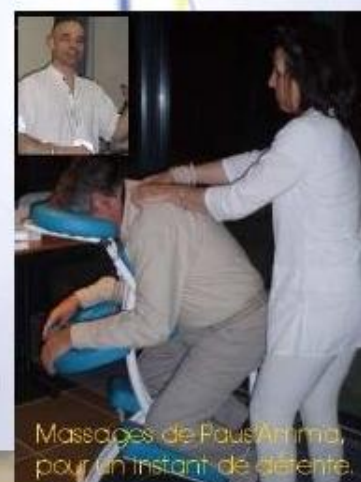
Massages de Paus'Amma, pour un instant de détente.